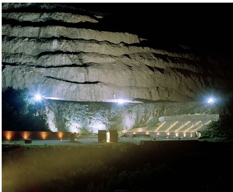
Teatro delle Rocce

Dai resti di una vecchia cava è nato uno spazio culturale polifunzionale per rappresentazioni teatrali, serate musicali, spettacoli di danza, concerti, convegni, manifestazioni d'arte, grandi eventi. Ecco che un'area per tradizione degradata diviene un luogo di incontro dalle grandi potenzialità di fruizione per attività culturali.