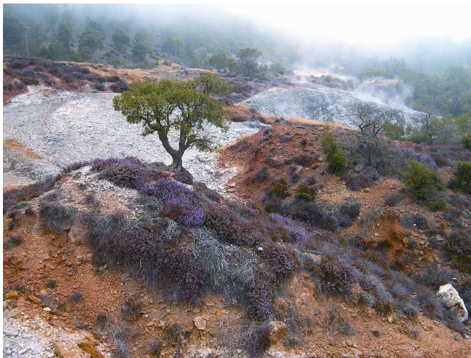
Geosito di interesse internazionale Le Biancane (Monterotondo Marittimo)

all'archeologia, al patrimonio storico-architettonico, nonché alle testimonianze delle attività minerarie e metallurgiche preindustriali e industriali.