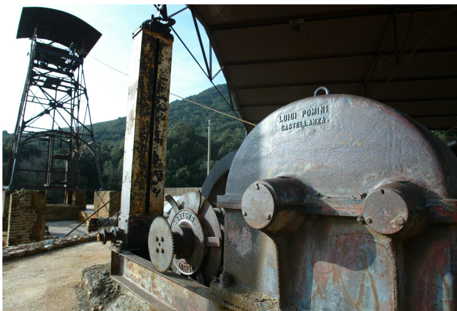
Miniera Ravi Marchi – Percorso museale