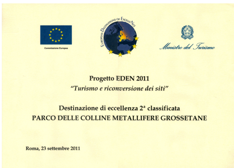
Certificato progetto EDEN

Nel 2011 il Parco Nazionale delle Colline Metallifere Grossetane ha partecipato al Bando Europeo EDEN dedicato ai progetti legati alla riconversione delle aree industriali e minerarie giungendo al secondo posto in Italia, potendosi fregiare del titolo (Destinazione Europea di Eccellenza) e dell'uso del logo.