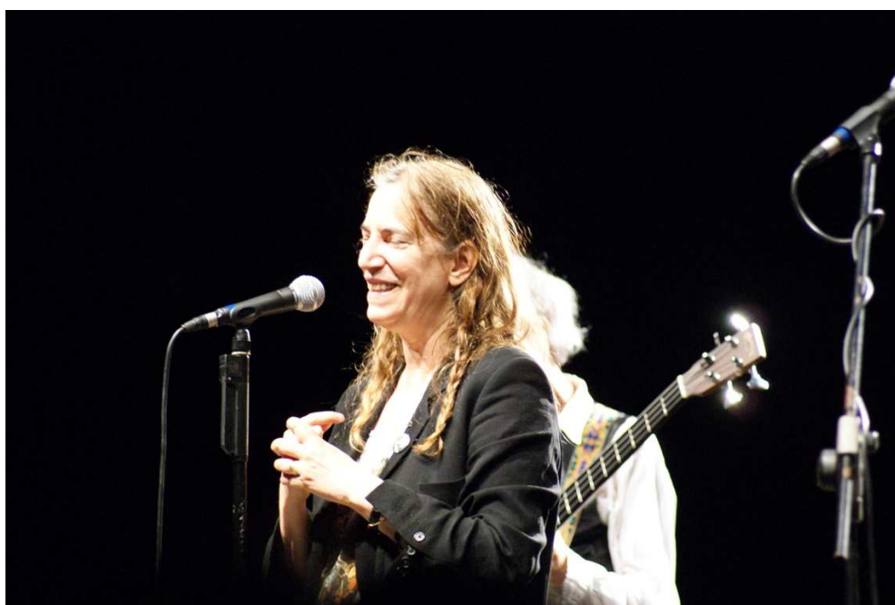
Patti Smith al Teatro delle Rocce

Ecco il teatro si apre al Festival Jazz Grey Cat e al Festival Internazionale Nuove Figure